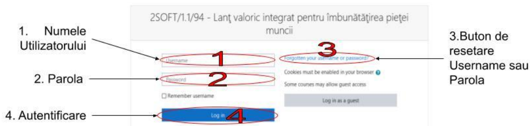
Figura 1. Pagina de autentificare

La accesarea site-ului veți ajunge la pagina de autentificare, prezentată în Figura 1.